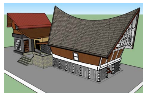
Gambar2 Desain Homstay di Rumah Adat