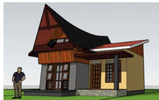
Gambar Desain Homestay non Rumah Adat

Ruang tidur diletakkan diatas Kamar mandi. Sehingga efektif memanfaatkan ruang atap untuk istirahat. Jendela kotak 3 menggambarkan bentuk panggung pada rumah tradisional yang disokong oleh balok-balok horizontal. Atap khas rumah adat toba dimunculkan dengan ornament di tengah. Memberi keseragaman pada lingkungan desa dan menguatkan karakter desa wisata.