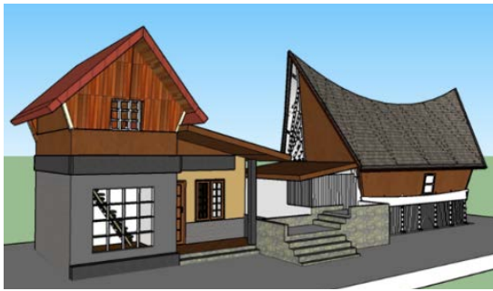
Gambar 3. Desain Homestay non Rumah Adat