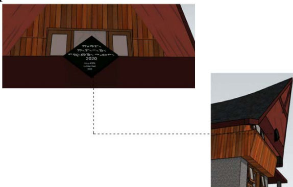
Gambar 5. Desain Ornamen Homestay non Rumah Adat

Ornamen didesain dengan memberikan bentuk ornamet baru. Terdapat di tengah pengganti gorga simatanari dalam rumah adat batak. Ornamen yang digunakan merupakan penyederhanaan bentuk Gorga Simatanari yaitu bentuk wajik dan diberi kaligrafi bahasa batak beserta artinya yaitu Program KSPN Desa Lumban Gaol 2020. Warna ornament sesuai dengan ornament khas Batak, merah hitam dan putih.