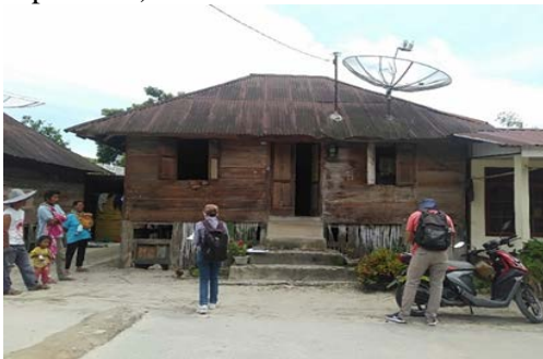
Gambar 4. Eksisting Rumah non Adat

Tidak berpagar dan tidak jelas batas tanah. Sisi samping rumah juga dilewati seperti gang milik umum. Hampir semua rumah di desa ini seperti itu.).