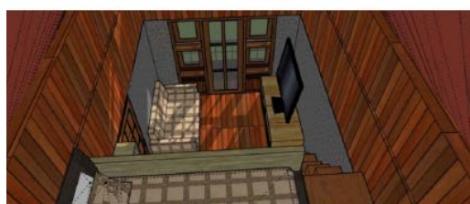
Gambar 6. DesainInterior Homestay non Rumah Adat